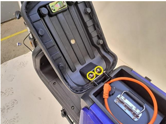
Irrota istuimen kiinnitysmutterit (kiintoavain 10 mm).