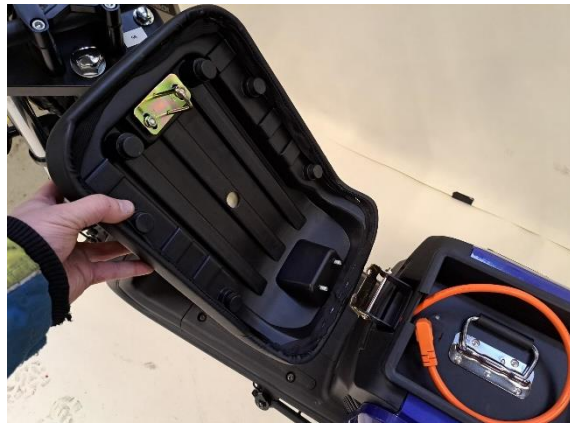
Ota istuin pois.